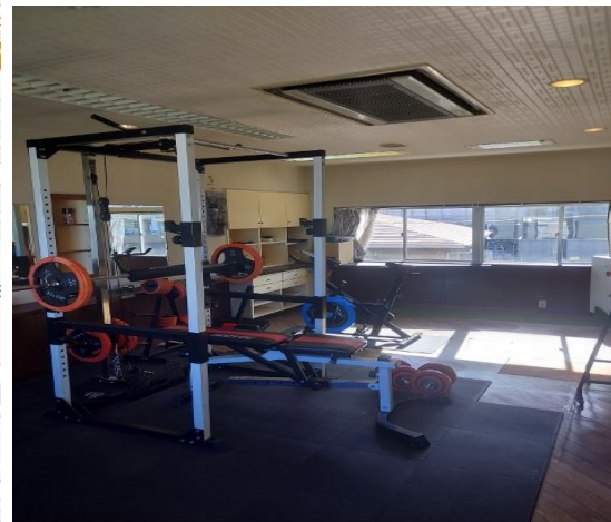
オーナー情報・問合せ先